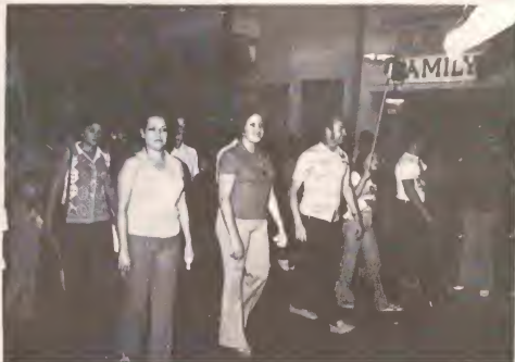
Un bista di e marcha di libertad na aña 1975, cual tabata un exito rotundo.

Na 1946 ela cuminsa su lucha pa separacion di Aruba den reinado, cual lucha ela hiba te dia cu ela fallece. Na